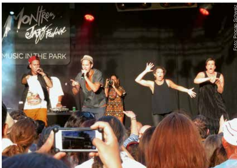
Jo2Plainp (2. von links) wird von den beiden Dolmetscherinnen übersetzt.

eine gut besuchte LaViva-Party statt. Diese Tanzpartys ermöglichen es Menschen mit und ohne Behinderungen, einander in einer entspannten Atmosphäre zu begegnen und Hemmschwellen abzubauen. Das Montreux Jazz Festival legt grossen Wert auf die Zugänglichkeit für Menschen mit Handicap. Dank der Beratung von Procap Schweiz haben die Organisatoren in den letzten Jahren mit verschiedenen Massnahmen die Zugänglichkeit des Festivals stark verbessert. [fs]